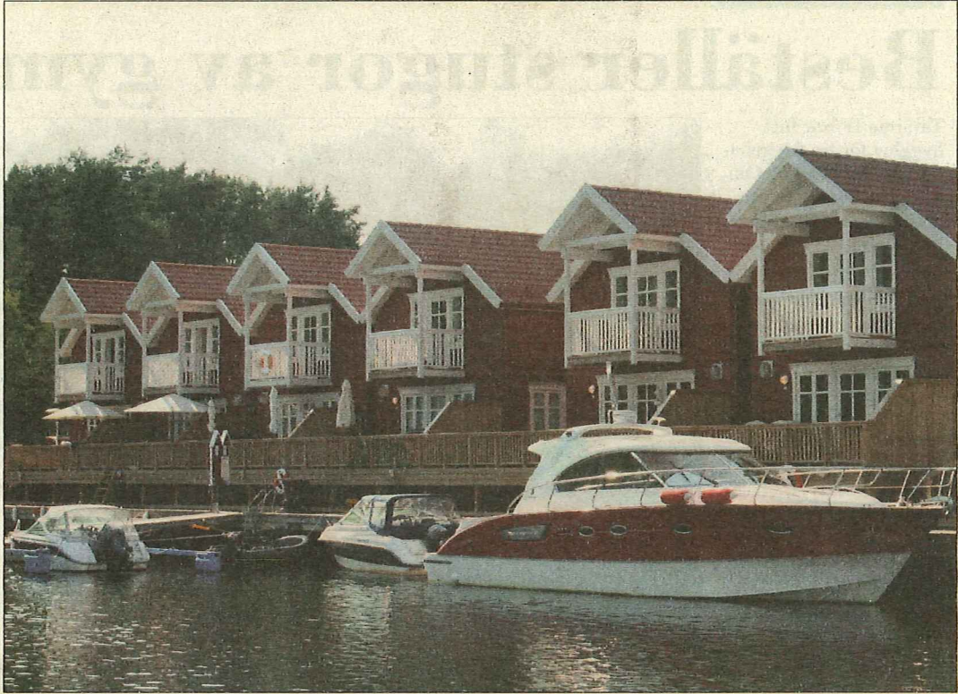
Både den kraftigare bebyggelsen och båttrafiken kommer att diskuteras inom projektet integrerad kustzonsplanering.

Väldigt heta somrar i Sydeuropa skulle till exempel kunna få många fler människor att vilja semestra här.